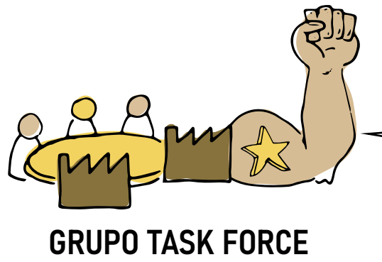
GRUPO TASK FORCE