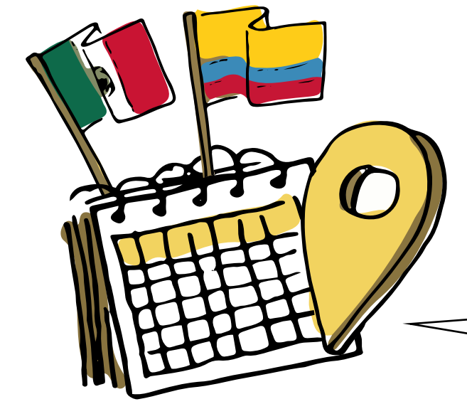
¿QUÉ TEMAS QUISIERAN TRABAJAR EL PRÓXIMO AÑO?