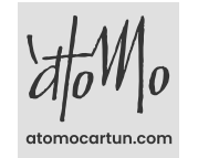
Imagen producida para el Grupo de Trabajo Binacional entre Colombia y México sobre Derechos humanos en la cadena de suministro. Programa desarrollado por Ministerio Federal de Cooperación Económica y Desarrollo de Alemania (BMZ) e implementado por la Deutsche Gesellschaft für Internationale Zusammenarbeit (GIZ), en alianza con Alliance for Integrity, la Cámara de Industria y Comercio Colombo-Alemana (AHK) y la Cámara Mexicano-Alemana de Comercio e Industria (AHK - CAMEXA). Encuentro virtual - 5 de diciembre de 2023.